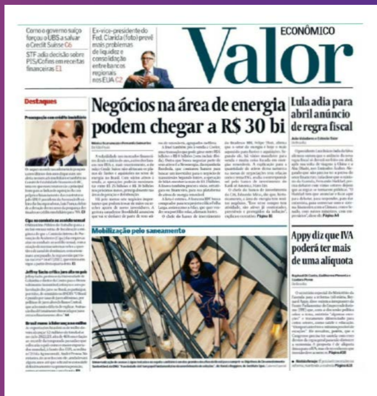
Capa do Jornal Valor Econômico (destaque) - 22.03.23

Ter o assunto da água e do saneamento presente na imprensa, nas mídias sociais e nos espaços de diálogo e construção de conhecimento é fundamental para que a urgência das soluções para essa demanda social seja percebida. A presença é elemento importante em nossa visão de transformação.